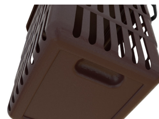
Hendidura en base que facilita la sujeción para el vaciado.