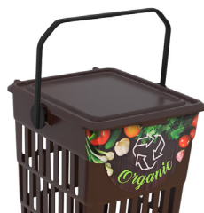
Con etiqueta residuo "Organic"