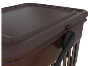
Detalle cierre tapa, mediante asa, impide apertura accidental