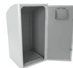
Sin contenedor interior