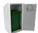
Con contenedor interior